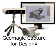
Geomagic Capture for DesignX