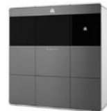
ProJet MJP 5500X