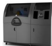
ProJet CJP 660Pro